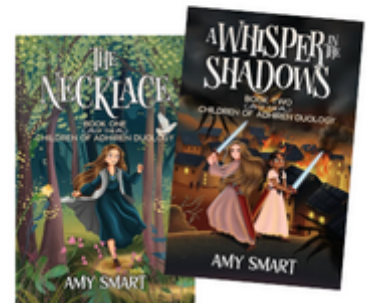
DMD VENDOR SPOTLIGHT