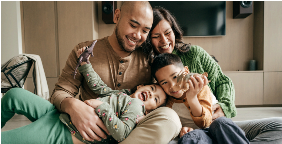
OUR NEWS: CAP PROGRAM ACCOUNCEMENT

See the full impact of our work in our Year in Review